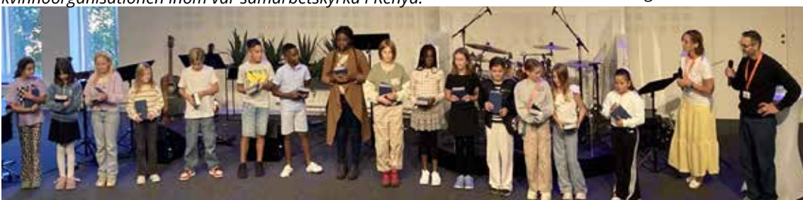
SEPTEMBER. Bibelutdelning till 10-åringarna som finns i våra verksamheter.