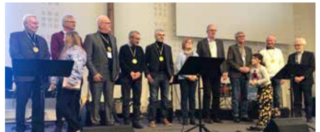
MARS. Veterangruppen fick medalj för väl utfört arbete i nya barnkyrkan.