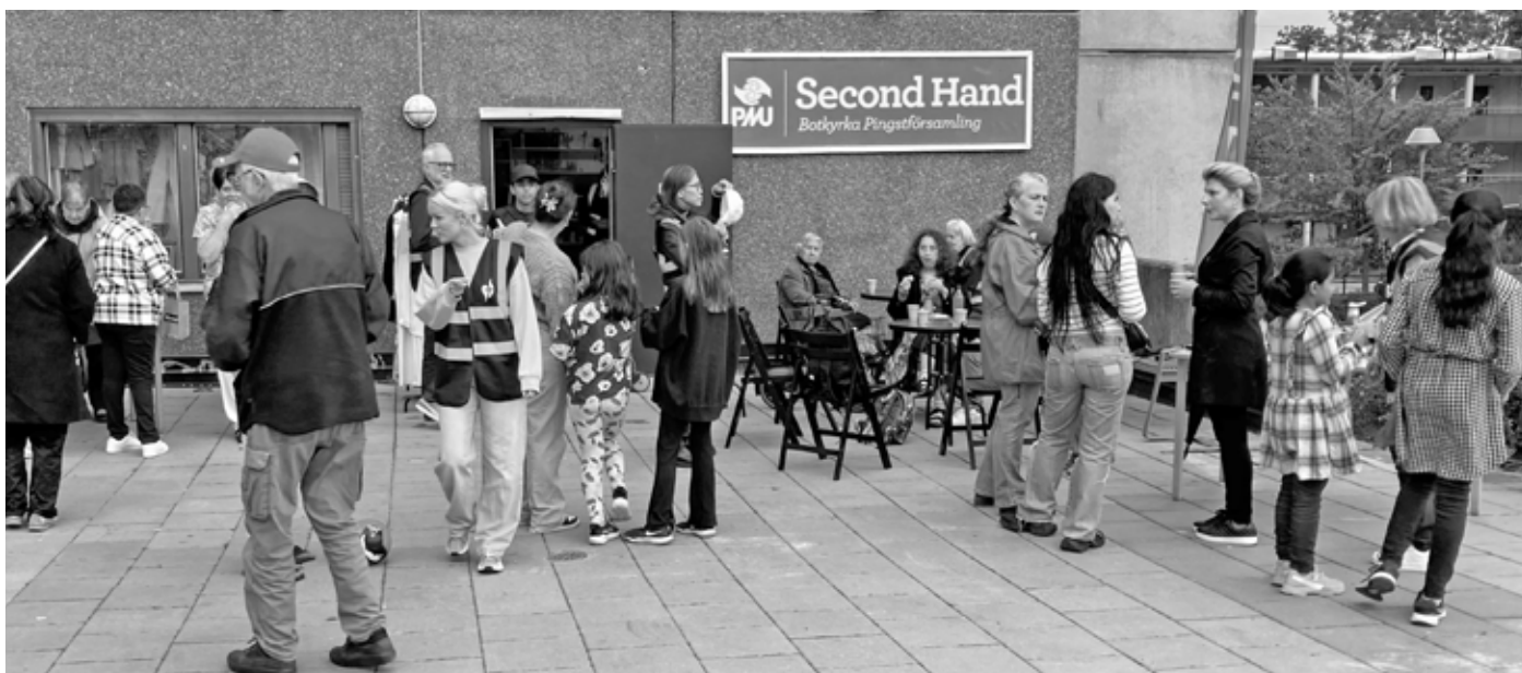
Vid upptaktshelgen inför hösten hade församlingen aktiviteter på flera platser i våra kommuner, bland annat vid butiken i Fittja.

Lördagssatsningen gick i mål med deltagande i områdets julmarknad. Här bjöd vi på fika och hade tävlingar