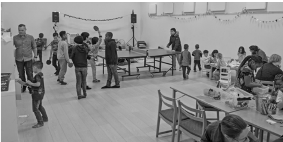
Aktivitetshallen i den nybyggda delen av kyrkan.