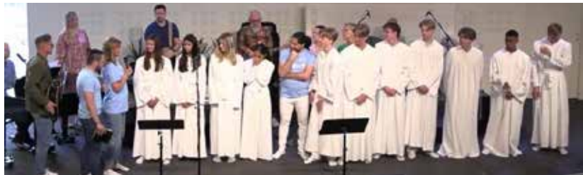
JUNI. Dopförrättning, bland annat med ett helt gäng konfa-deltagare.