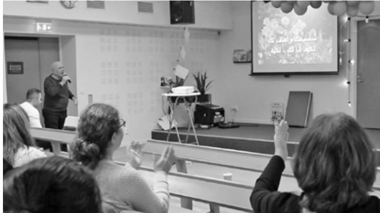
Arabiska gruppen samlas varje lördag för gudstjänst och gemenskap.

– Jag vill tacka igen för stöd, förböner, ekonomisk hjälp och omsorg om människorna där.