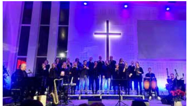
DECEMBER. Fullsatt kyrka under årets julkonsert.