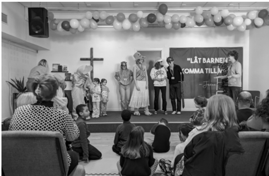
Ungefär 70 barn deltar i Barnens gudstjänst under en söndag. Den 12 mars invigdes nya Barnkyrkan med Jesusparty och fest!

I APRIL DROG VÅRA Familjekvällar igång. Kvällen börjar alltid med en gemensam måltid, innan föräldrar har en samling och barnen sin egen. Vi avslutar med andakt tillsammans. Temat för årets kvällar har varit "Dela tron i hemmet" och vi har bland annat fått tips på hur man kan be och läsa Bibeln tillsammans hemma. Mycket uppskattade kvällar bland våra familjer!