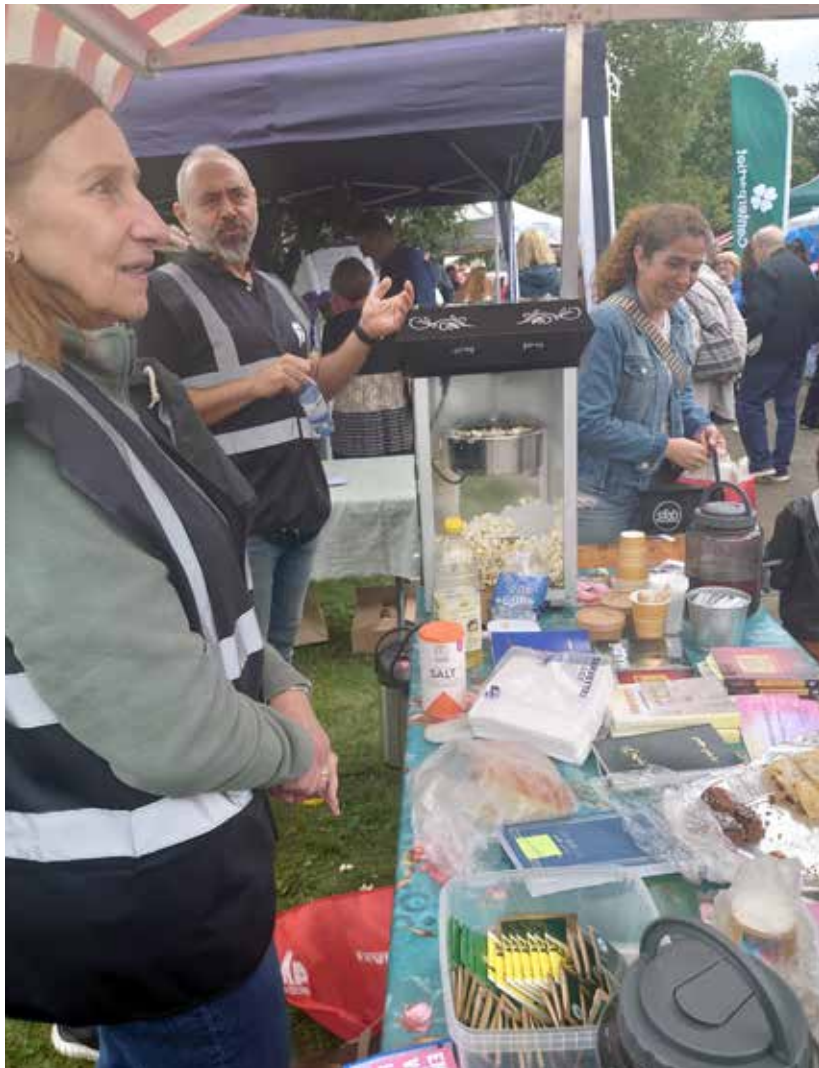
AUGUSTI. Husförsamlingar i Salem representerade församlingen på Salemsdagen.