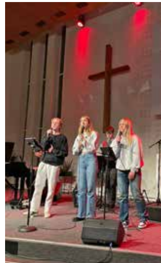
Lovsång på Open.