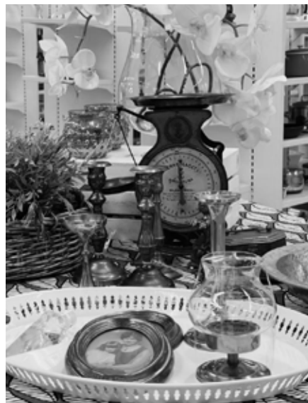
Det finns alltid många fynd att göra på Second Hand.

Stickgruppen med drygt 10 personer har fortsatt att träffas varannan vecka i butiken. Arbetet består i att sticka klädesplagg, som skickas till missionen i framför allt Afrika. Stickmaterial erhålls från inlämnade gåvor i butiken.