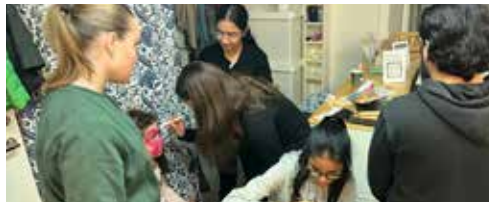
OKTOBER. Ansiktsmålning i vår