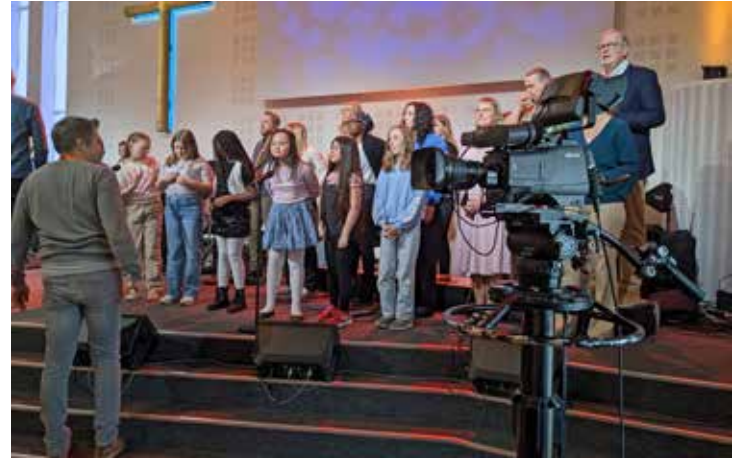
APRIL. SVT kom på besök. Resultatet blev fyra tv-gudstjänster som sändes i maj och juni.