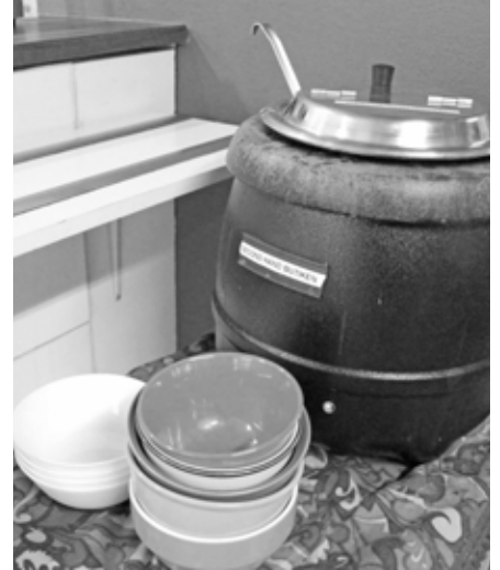
Torsdagarnas soppluncher i butiken är mycket uppskattade.

Under året har totalt två personer, som varit placerade i butiken av myndigheterna, fått fasta anställningar ute på arbetsmarknaden, vilket vi är mycket glada över.