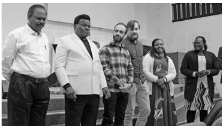
Efter år av pandemi fick vi till slut möta några av våra samarbetspartner.