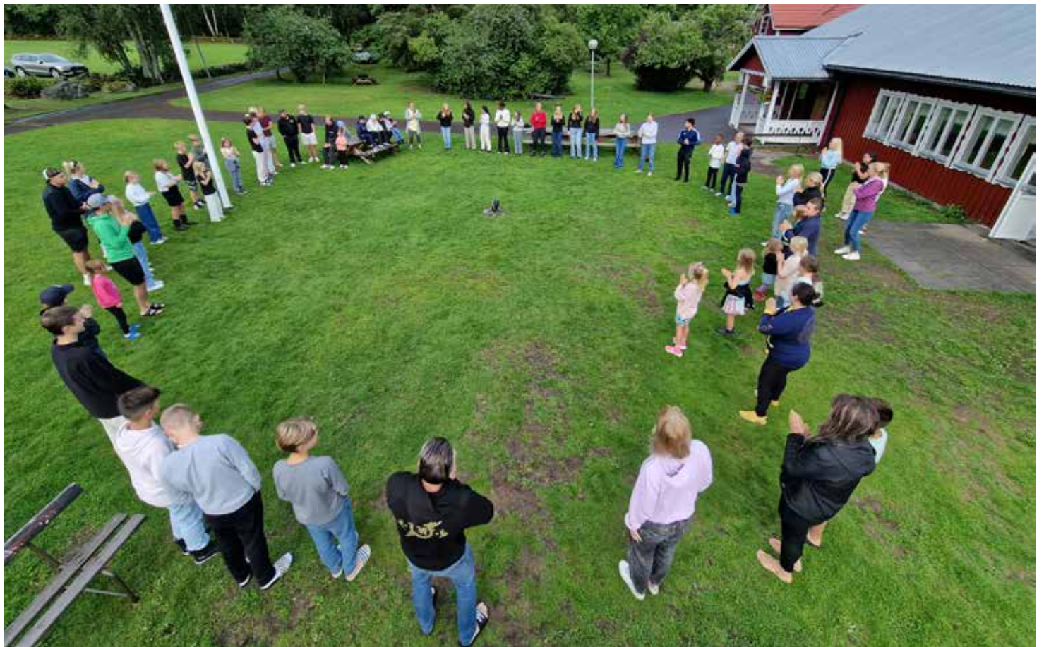
AUGUSTI. Barn- och tonårslägret på Björkenäsgården började varje morgon med samling vid flaggstången.