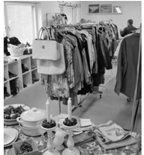
Stort utbud av varor i Second handbutiken i Fittja.

Vi får vara en del av de lokalboendes liv, vi är inte främmande för allt som sker i området oavsett om det är jobbiga eller bra saker. Vi ses inte som några som kommer utifrån, vi är en del av Fittja.