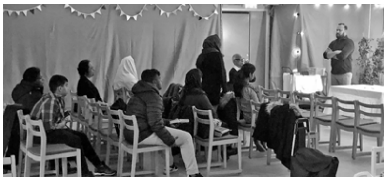
Gudstjänst med tamilska gruppen.

Tamilska gruppen tycker att år 2022 var ett välsignat år, eftersom de kunde fira gudstjänst i kyrkan varje söndag.