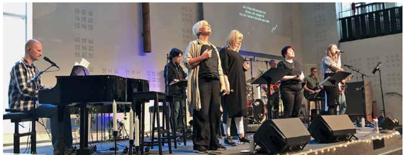
Lovsångskväll i maj.