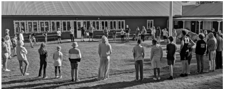
Sommarläger på Björkenäsgården.

Barnkören har framfört två bejublade föreställningar: På våren "Jesus och hans liga" och i december "Julens höjdpunkt". Delar av barnkören har också