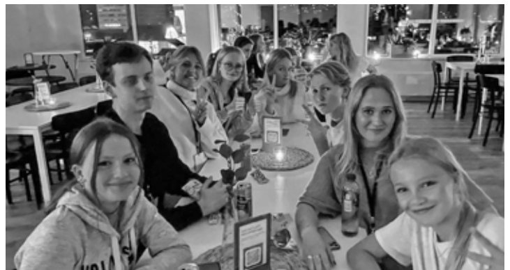
"Häng" runt fikaborden på fredagskvällen.

Med tacksamhet över året som varit stiger vi in i ett nytt år med hopp om att få se ungdomar komma till tro och att vi tillsammans växer i vår tro.